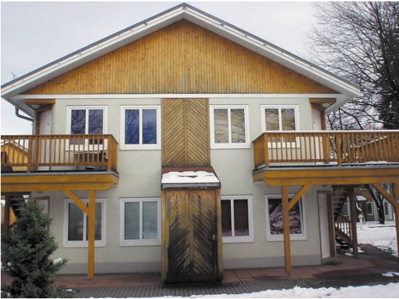
ein Überholungsanstrich ist hier nicht mehr möglich